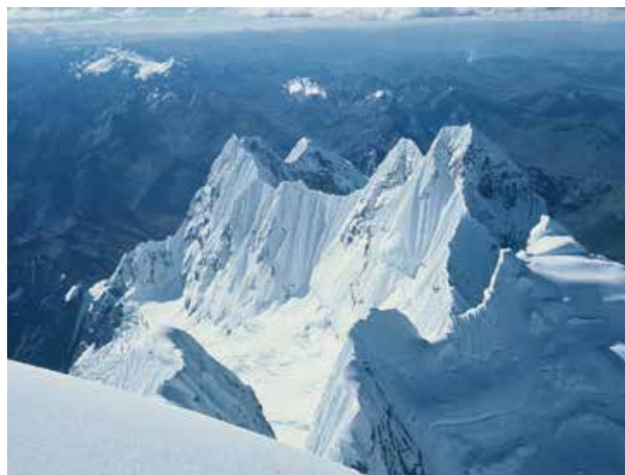
Pogled z vršnega grebena Yerupaje Grande na severne vrhove Cordilliere Huayhuash in pampo proti Amaconki