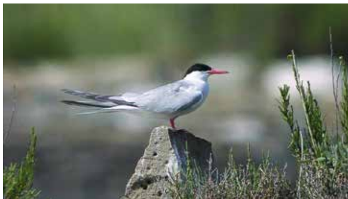
Navadna čigra