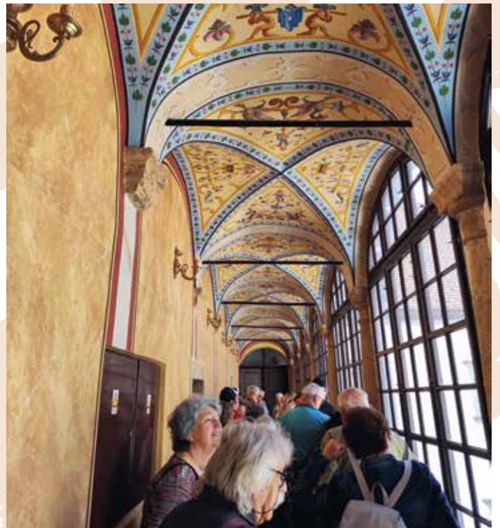
Hodnik sevniškega gradu, foto: Aleš Lagoja. Restavrirane baročne freske v Gradu Sevnica so danes največji okras te stavbe, ki bogati življenje mesta ob Savi.