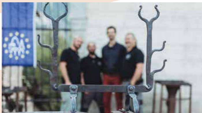
Koza, Dnevi evropske kulturne dediščine 2021 - kovaška delavnica