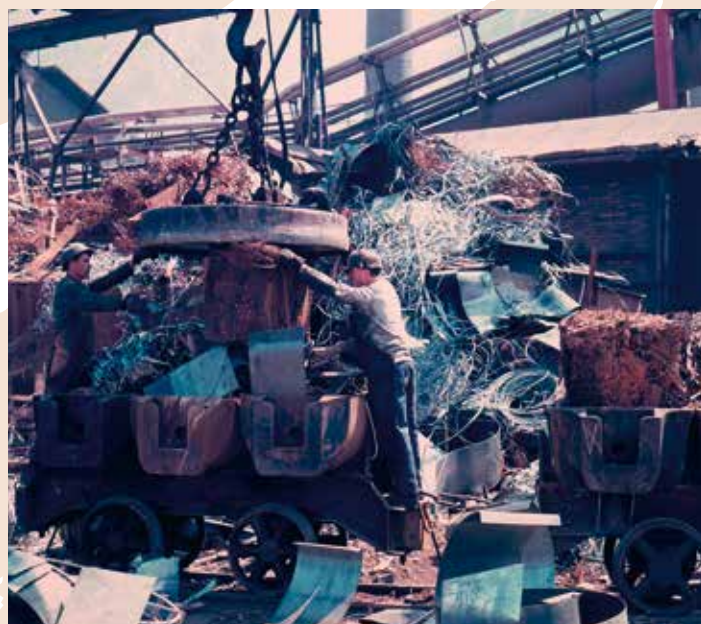
Nakladanje starega železa za prevoz v jeseniško Siemens-Martinovo jeklarno sredi 20. stoletja