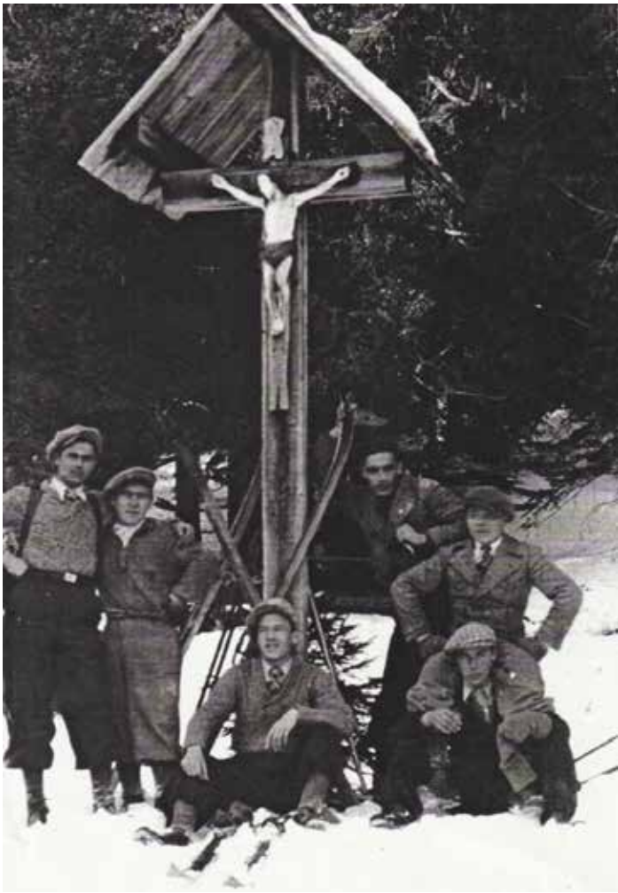
Pod razpelom na Križevcu ok. leta 1935. (Vir fotografije: Frančišek Noč, pobudnik postavitve spominskega znamenja leta 1992. Dokumentacijo pok. Frančiška Noča hrani Marko Zupančič, boter znamenja.)