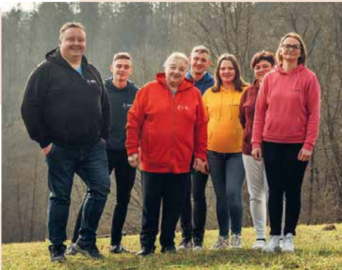
Tri generacije na kmetiji Gnidica pa so nam s pekarskimi in sukomesnatimi izdelki približale pristne okuse krškopoljskih pridelkov.