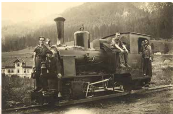
Ozgotirna parna lokomotiva IV. (kasneje O-II) okoli leta 1930