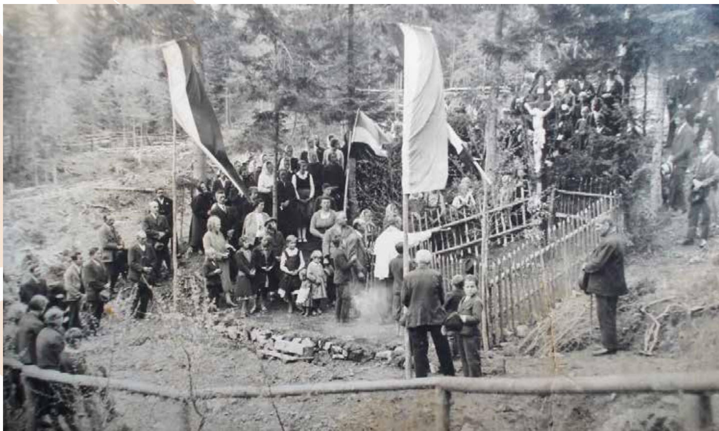
Blagoslov znamenja na Križevcu, čas med obema vojnama.