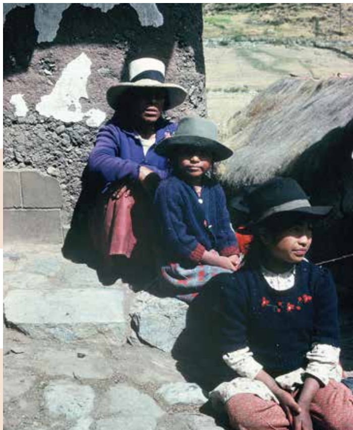
Družina Indijank plemena Kečua iz vasi v pampi na vzhodni strani Andov, foto: Janez Dovžan