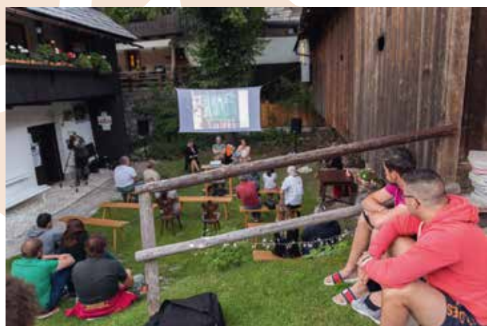
Filmi pod lipo

Špela Smolej Milat, kustodinja za etnologijo GMJ