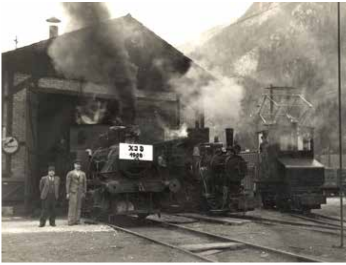
Tovarniška kurilnica leta 1908 z lokomotivami KID-I, III (kasneje O-I) in E-I