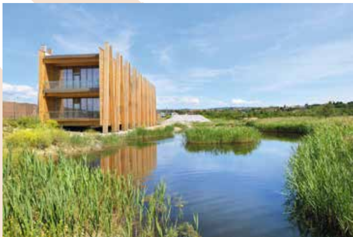
Naravni rezervat Škocjanski zatok

Ker je pristanišče varovano območje, morate s seboj imeti osebni dokument . Pred vstopom je potrebno oddati tudi »Vlogo za izdajo dovoljenja za dostop na območje koprškega tovarnega pristanišča - za organiziran ogled pristanišča«, zato ob prijavi na izlet poleg imena in priimka pripravite še naslednje podatke: datum rojstva ter številko in vrsto osebnega dokumenta (osebna izkaznica ali potni list) .