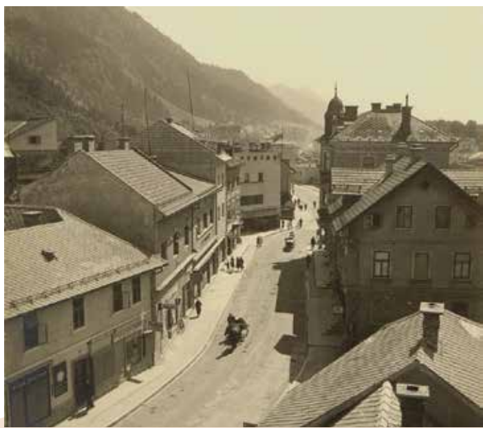
Gospodstvska cesta l.1935-1939

V naši enoti Muzej Kosova graščina na Jesenicah pripravljamo novo stalno muzejsko razstavo, ki bo prikazala prva leta mesta Jesenice. Muzealci bomo prikazali