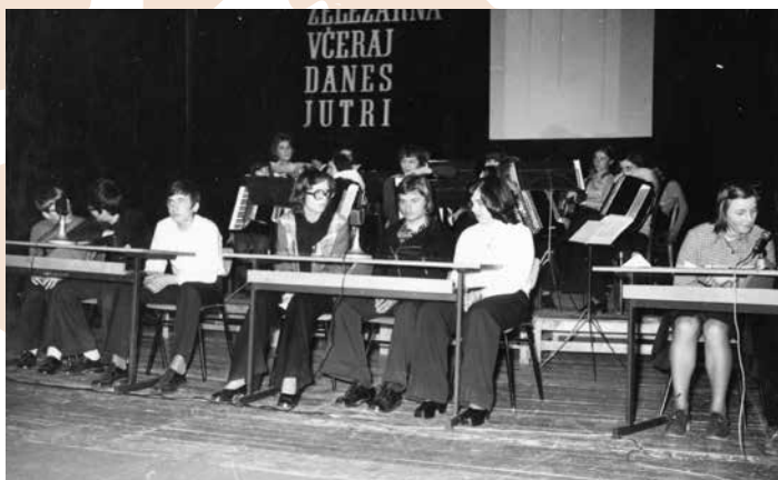
Kviz Železarna včeraj danes jutri - izvajalec Tehnični muzej Jesenice