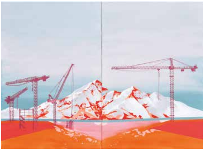
Mesto rdečega prahu, diptih, akril in flomaster na platnu, 120 x 80cm, 2024