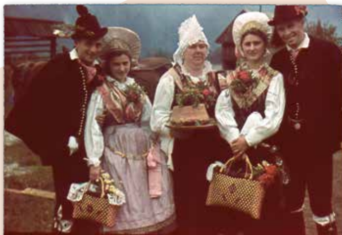
Kulturni festival na Jesenicah 1940, Kmetska ohcet, Foto: Ivo Koželj (fototeka GMJ)

Gornjesavski muzej Jesenice Aljaž Pogačnik, direktor