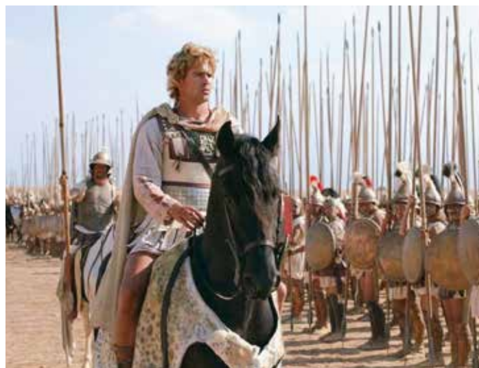
Colin Farrell v filmu Aleksander

Ko je umiral, je menda naročil: “Pokopljite moje telo in ne postavljajte nobenega spomenika. Roke naj ostanejo