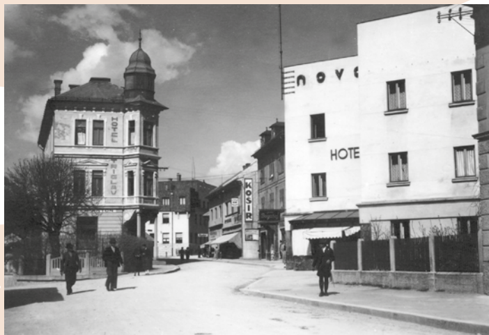
Gospodstvska ulica s hotelom Triglav v ozadju, 1937-1940

zgodovino nekdanj najmlajšega mesta v Kraljevini Jugoslaviji, od leta 1929, ko je bilo ustanovljeno, pa do sredine 50. let 20. stoletja, ko se je mlado mesto urbanistično, družbeno in kulturno najbolj spremenilo in začrtalo pot razvoja in duha industrijskega mesta, ki ga je čutiti na Jesenicah še dandanes. Poseben poudarek bomo namenili 2. svetovni vojni in zavezniškemu bombardiranju Jesenic spomladi leta 1945. V razstavo bo vključena tudi že obstoječa zaporniška celica – samica, ki bo opozarjala na preteklo tragično obdobje mesta, ko je graščino uporabljal GESTAPO. Muzejska razstava bo mesto predstavila iz zgodovinskega, umetnostno zgodovinskega in etnološkega vidika. Na razstavo umeščeni predmeti iz naših depojskih zbirk bodo obogateni in interpretirani tudi z digitalno vsebino in posebnimi pedagoškimi ter andragošskimi programi.