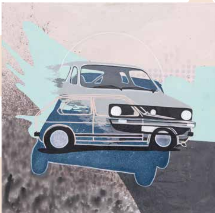
Golf 1, akril in flomaster na platnu, 100 x 100cm, 2017

Lea Svrzikapa s svojim slogom razkriva poznavanje moderne umetnosti druge polovice 20. stoletja in post-modernizma, ideje izraža s samozavestno potezo umetnice, ki je strokovno izobrazbo ter izkušnje nadgradila predvsem s tem, da je poslušala sebe. S svojimi upodobitvami industrijskega pejzaža se je pridružila slikarjem in slikarkam, ki so se ali pa se