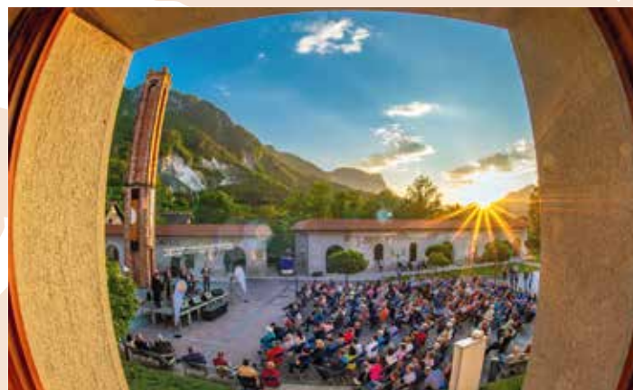
Jeseniško poletje Koncert klape Sol, Foto Vidmar, julij 2023 (fototeka GMJ)