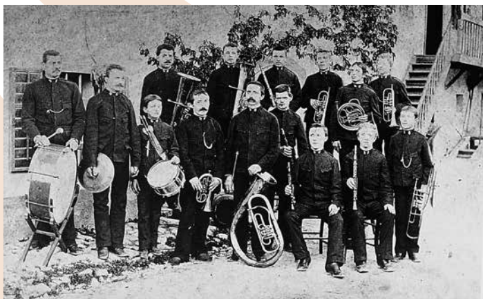
Godba požarne brambe, 1887

Tema letošnjega kviza mesta Jesenice bodo seveda Jesenice, ki letos obeležujejo 95 let, odkar so postale mesto ter zgodovina pihalnih godb, katerih naslednik POJKG letos praznuje 150. obletnico. Mladi bodo svoje znanje na ti dve temi dokazovali na finalu, ki bo potekalo v ponedeljek, 18. marca 2024, ob 17.