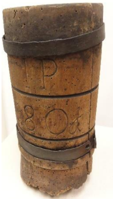
GMJ Ž 234; Tof za izdelovanje kisa, Gorje, 1801, pridobitev: 1956.