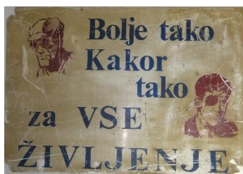
GMJ Ž 4192; Opozorilna tabla, 20. stoletje, Vzdrževanje Javornik, Železarna Jesenice, pridobitev: 2003.