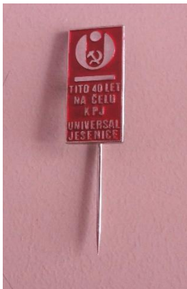
GMJ Ž 4906; Značka Tito 40 let na čelu KPJ, Universal Jesenice,