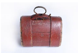
GMJ Ž 1463; Petrih, Tovorniška gostilna Razingar, Jesenice, 1840, pridobitev: 1961.