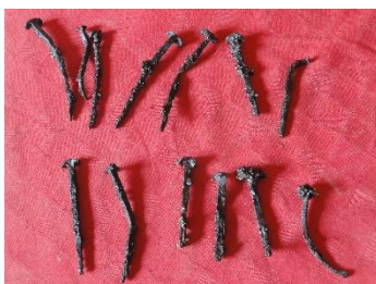
GMJ Ž 4878; Žebelj, Javornik, 19. stoletje, pridobitev: 2021.