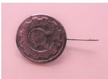
GMJ Ž 4902; Značka Razstava Delo, Jesenice, 1947, pridobitev: 2022.