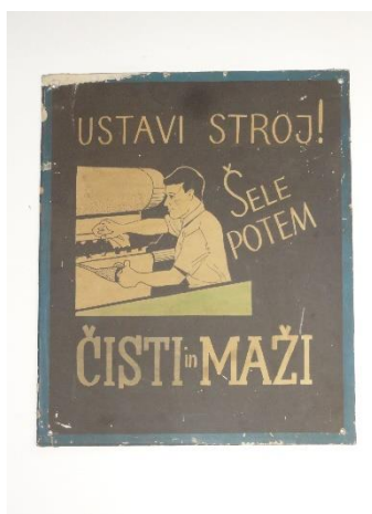
GMJ Ž 4193; Opozorilna tabla, 20. stoletje, Vzdrževanje Javornik, Železarna Jesenice, pridobitev: 2003.