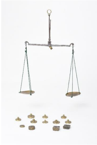
GMJ Ž 379; Tehnica za tehtanje denarja, Jos. Florenz, Wien, Planina pod Golico, 19. stoletje, pridobitev: 1963.