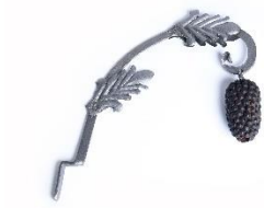
GMJ Ž 1470; Izvesek, Tovorniška gostilna Razingar, Jesenice, 19. stoletje, pridobitev: 1961.