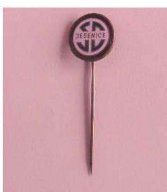
GMJ Ž 4899; Značka ŠD Jesenice, Jesenice, 1970–1990, pridobitev: 2022.