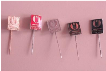
GMJ Ž 4904/1, 2, 3, 4, 5; Značka 15 let Universala Jesenice, Jesenice, 1970–1990, pridobitev: 2022.