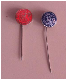
GMJ Ž 4905/1, 2; Značka Železarna Jesenice, Jesenice, 1970–1990, pridobitev: 2022.