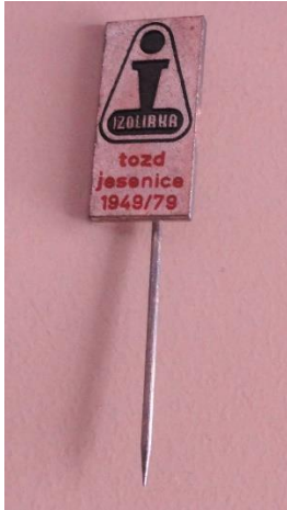
GMJ Ž 4911; Značka Izolirka TOZD Jesenice, Jesenice, 1979, pridobitev: 2022.