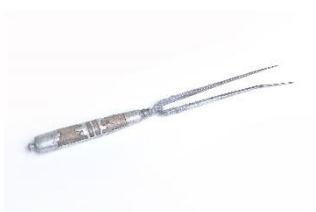
GMJ Ž 2011; Vilice, Studor, 19. stoletje, pridobitev: 1961.