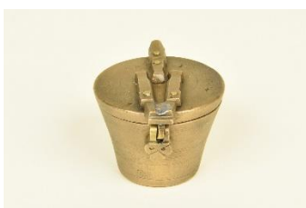
GMJ Ž 799; Uteži na unče, Kemijski laboratorij Kranjske industrijske družbe, 19. stoletje, pridobitev: 1951.