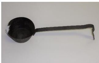
GMJ Ž 1710; Ponev za zabelo, Kamna Gorica, 19. stoletje, pridobitev: 1963.