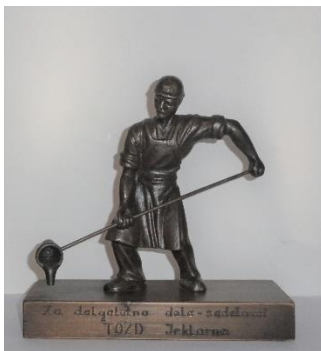
GMJ Ž 4912; Kipec topilca, Železarna Jesenice. 1970 – 1990, pridobitev: 2022.