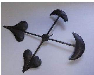
GMJ Ž 586; Urni kazalci, Cerkev Marijinega vnebovzetja in sv. Roka na Stari Savi, 19. stoletje, pridobitev: 1954.