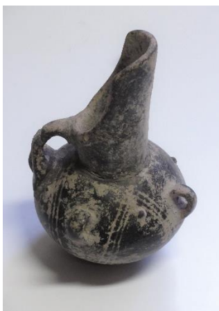
GMJ Ž 2905; Amfora, spominska skulptura, 1968, Ankara, pridobitev: 1997.