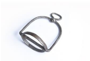
GMJ Ž 275; Stremence, Studor, 19. stoletje, pridobitev: 1950.