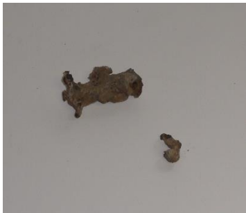
GMJ Ž 555; Žindra iz slovenske peči, Kropa, 14. – 16. stoletje, pridobitev: 1966.