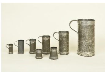
GMJ Ž 4310–4316; Merilne posode, OŠ Koroška Bela, 1. polovica 20. stoletja, pridobitev: 2009.