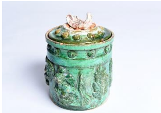
GMJ Ž 1469; Solnica, Tovorniška gostilna Razingar, Jesenice, 19. stoletje, pridobitev: 1961.