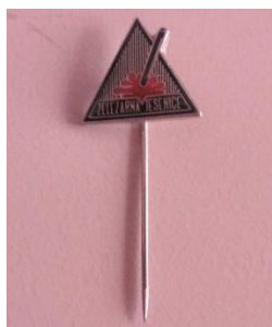
GMJ Ž 4909; Značka Elektrode Jesenice, Jesenice, 1989, pridobitev: 2022.