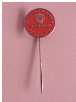
GMJ Ž 4910; Značka Vatrostalna Zenica TOZD Jesenice, Jesenice, 1970 – 1990, pridobitev: 2022.