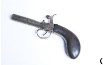
GMJ Ž 1105; Pištola, Bohinjska Bistrica, 18. stoletje, pridobitev: 1954.