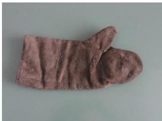
GMJ Ž 3209; Azbestne rokavice, 20. stoletje, Železarna Jesenice, pridobitev: 1997.