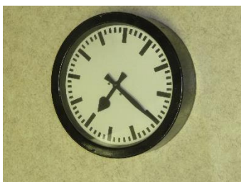
GMJ Ž 4555; Ura iz glavne pisarne Železarne Jesenice, 2. polovica 20. stoletja, pridobitev: 2012.