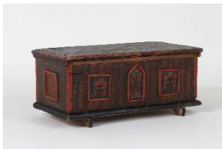
GMJ Ž 1981; Skrinjica, Češnjica, 1832, pridobitev: 1961.