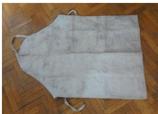
GMJ Ž 3197; Azbestni predpasnik, 20. stoletje, Železarna Jesenice, pridobitev: 1997.