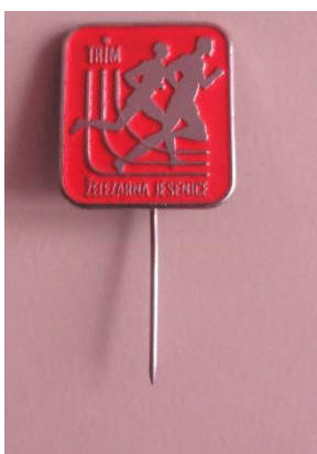
GMJ Ž 4901; Značka Trim Jesenice, Jesenice, 1970 – 1990, pridobitev: 2022.