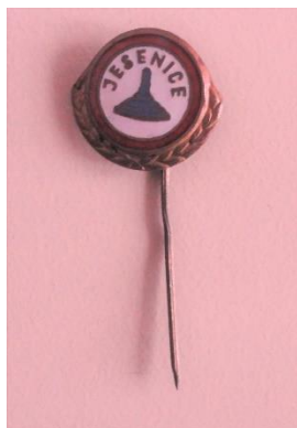
GMJ Ž 4908; Značka Kegljaško društvo Jesenice, Jesenice, 1970–1990, pridobitev: 2022.