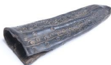
GMJ Ž 1453; Nožnica, Češnjica, 19. stoletje, pridobitev: 1960.