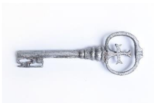
GMJ Ž 2032; Ključ za skrinjo, staro železo Železarne Jesenice, 19. stoletje, pridobitev: 1961.