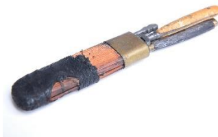
GMJ Ž 1472; Šivilni pribor, Bohinjska Bistrica, 19. stoletje, pridobitev: 1960.