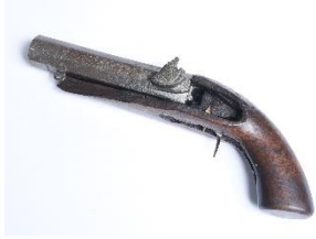
GMJ Ž 1468; Pištola, Tovorniška gostilna Razingar, Jesenice, 18. stoletje, pridobitev: 1961.