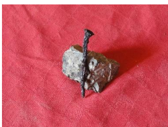
GMJ Ž 4879; Žebelj, Javornik, 19. stoletje, pridobitev: 2021.