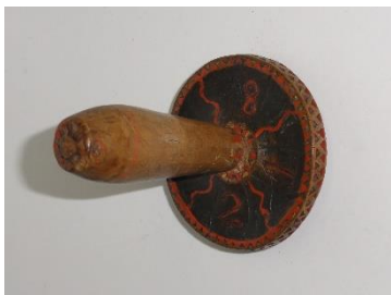
GMJ Ž 1372; Gobica za šivanje nogavic, Moste pri Žirovnici, 1832, pridobitev: 1957.