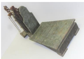
GMJ Ž 4244; Tehtnica, Bled, 1889, pridobitev: 2007.