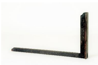
GMJ Ž 738; Kotnik, Stara Fužina, 1802, pridobitev: 1952.