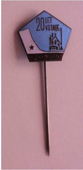
GMJ Ž 4903; 20 let vstaje, Železarna Jesenice, Jesenice, 1961, pridobitev: 2022.