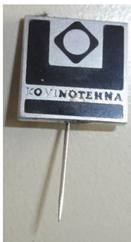
GMJ Ž 4907; Značka Kovinotehna, Jesenice, 1970–1990, pridobitev: 2022.