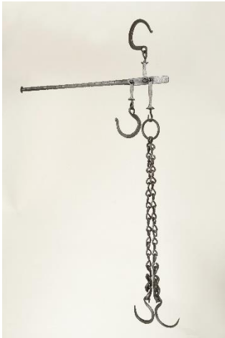
GMJ Ž 1165; Tehtnica na funte, Murova, 19. stoletje, pridobitev: 1955.