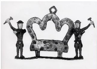
GMJ Ž 378; Obešalo za rudarsko bandero, Planina pod Golico, 19. stoletje, pridobitev: 1951.