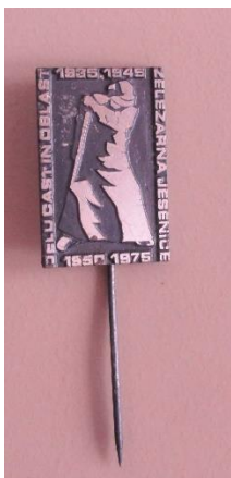
GMJ Ž 4897; Značka Delu čast in oblast, Železarna Jesenice, Jesenice, 1975, pridobitev: 2022.