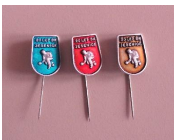
GMJ Ž 4898/1, 2, 3; Značka 20 let BK Jesenice, Jesenice, 1970–1990, pridobitev: 2022.