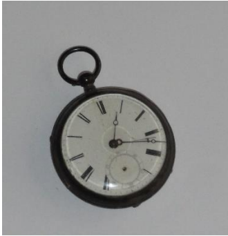
GMJ Ž 803; Žepna ura Mavricija Smoleja, začetek 20. stoletja, Jesenice, pridobitev: 1964.