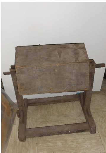
GMJ Ž 1703; Čistilni boben, Kamna Gorica, 19. stoletje, pridobitev 1963.