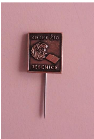
GMJ Ž 4900; Značka 40 leta ŽIC Jesenice, Jesenice, 1978, pridobitev. 2022.