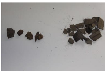
GMJ Ž 2051; Keramika in kosi železa, Planina pod Golico, srednji vek, pridobitev: 1962.