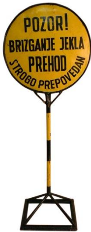
GMJ Ž 2989; Tabla z napisom pozor brizganje jekla, 20. stoletje, SM jeklarna, pridobitev: 8. 7. 1998.