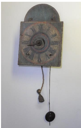
GMJ Ž 1456; Stenska ura, fužina v Radovni, 1647, pridobitev: 1960.