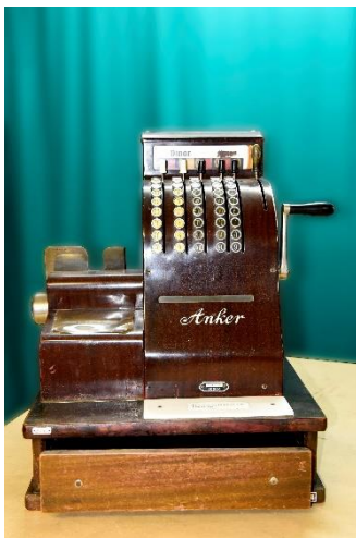
GMJ Ž 3161; Blagajna, 20. stoletje, Bielefeld, trgovina Žvan, pridobitev: 1995.