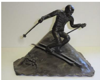
GMJ Ž 4181; Kovana skulptura, 20. stoletje, Kropa, Železarna Jesenice, pridobitev: 2003.