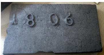
GMJ Ž 292; Grodelj iz javorniškega plavža, 1806, pridobitev: 1950.