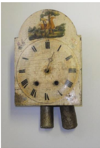
GMJ Ž 1366; Stenska ura, plavž na Javorniku, 1799, pridobitev: 1957.