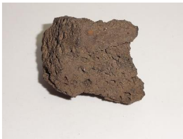
GMJ Ž 531; Žindra, Kamna Gorica, 19. stoletje, pridobitev: 1951.