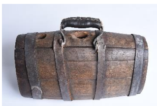
GMJ Ž 1464; Petrih za vino, Tovorniška gostilna Razingar, Jesenice, 19. stoletje, pridobitev: 1961.