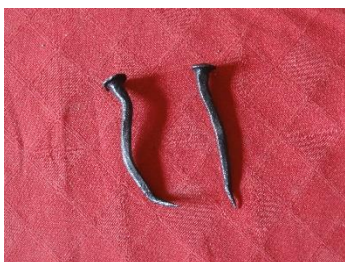
GMJ Ž 4877; Kovan žebelj, Javornik, 19. stoletje, pridobitev: 2021.