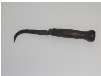
GMJ Ž 705; Nož za rezanje srobot, Stara Fužina, 19. stoletje, pridobitev: 1952.