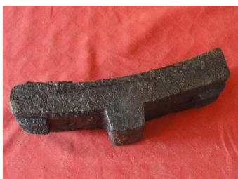
GMJ Ž 4880; Železna zavora, Javornik, 20. stoletje, pridobitev: 2021.