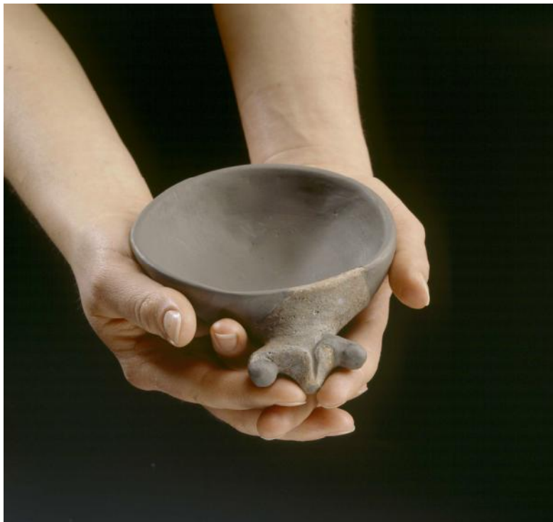
Keramična skodelica iz časa mlajše kamene dobe z Drulovke pri Kranju (avtor T. Lauko)