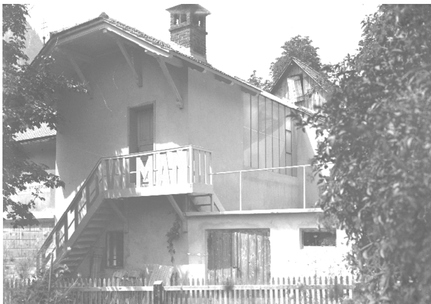
Nekdanji fotografski atelje Franca Vilmana na Stari Savi (foto Franc Vilman)